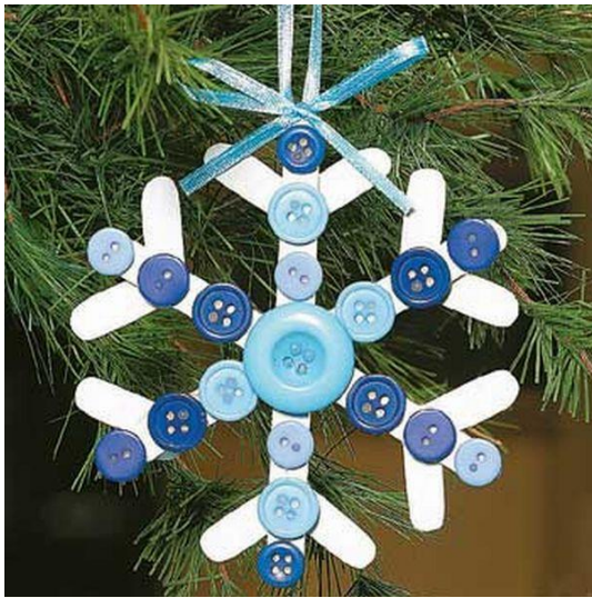
Снежинка из пуговиц

Но украсив своё жилище, не забудьте уделить достойное внимание главному атрибуту праздника – красавице ёлке. Выбор игрушек для её украшения сейчас впечатляет. Но может быть не стоит все внимание уделять шарам и привычным для нас украшениям? Давайте пофантазируем и применим в качестве украшений игрушки, изготовленные из подручного материала.