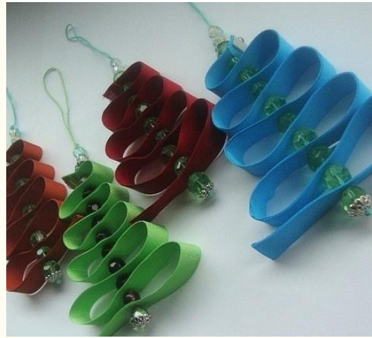
Елочки из атласной ленты и бус